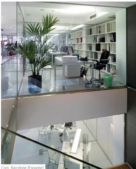
Corp, Barcelone (Espagne)