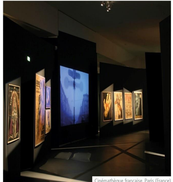
Cinémathèque française, Paris (France)