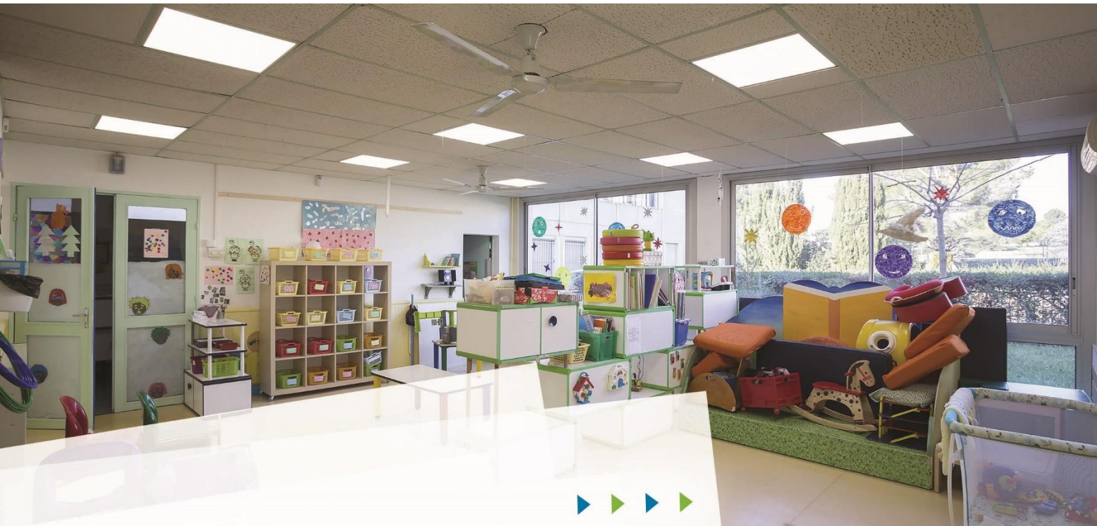
Crèche « Les Heures Creuses » (Entressen, France)