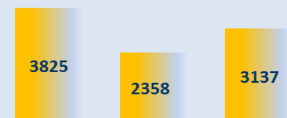
Résultat Net (K€)