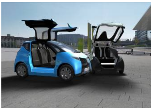
AKKA, Astute Car, 5 familles d'innovations et brevets

L'international affiche des performances en hausse de 23,5% à 49,9 M€.