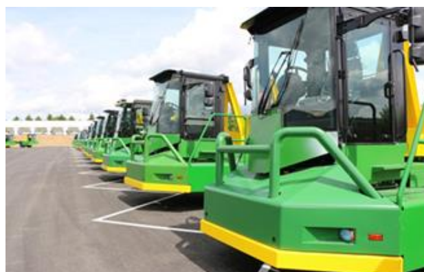
DOCKING STATION & ATT LIFT PELINDO