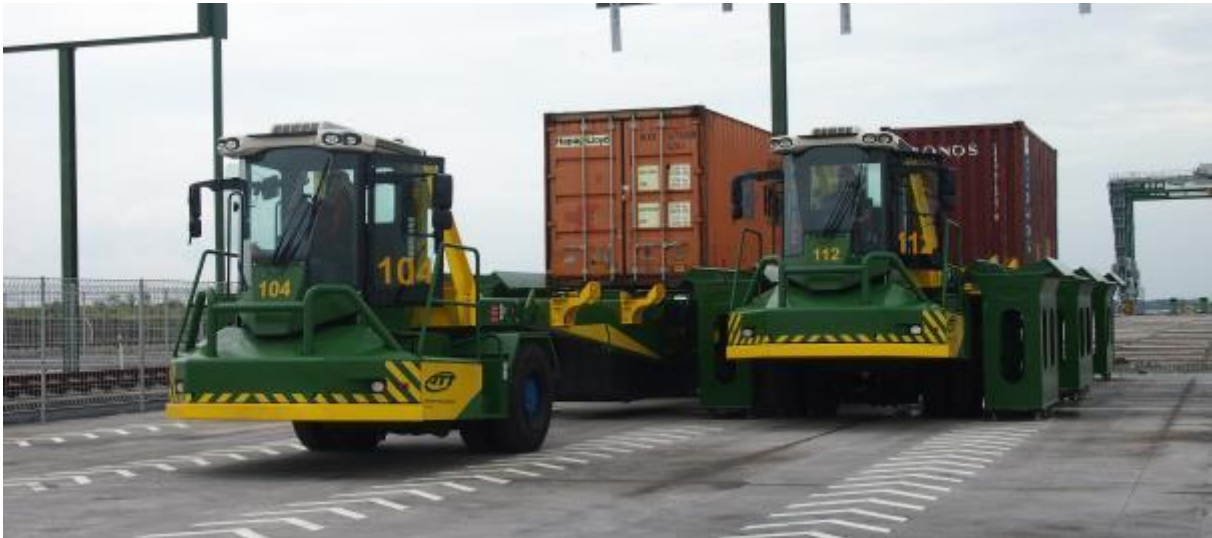
2 ATT LIFT déposent et posent en mode automatique en moins de 3 minutes des containers dans la docking station elle-même dotée de 5 baies au pied de la grue ASC (Automatic Stacking Crane)