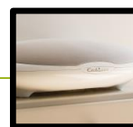
HIGH-FIDELITY AUDIO STREAMING