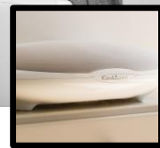
HIGH-FIDELITY AUDIO STREAMING