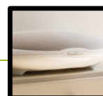
HIGH-FIDELITY AUDIO STREAMING