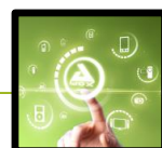
SMART HOME TECHNOLOGIES