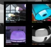
SMART & HYBRID LIGHTING