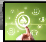
SMART HOME TECHNOLOGIES