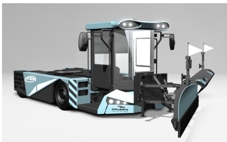
ATM avec option lame à neige