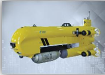
Systèmes Intelligents de Sûreté