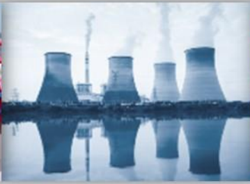
Protection en Milieux Nucléaires