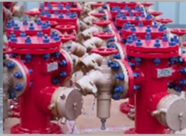
Projets et Services Industriels