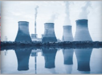
Protection en Milieux Nucléaires