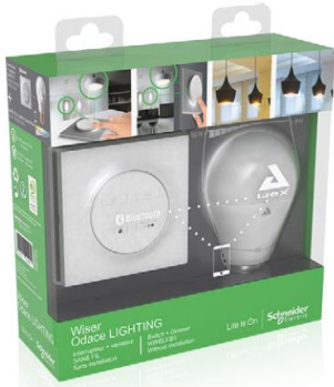
White kit Comfy illumination

Depuis début décembre, Wiser Odace LIGHTING est commercialisé seul en finition blanche, aluminium ou anthracite, et à travers 3 packs d'éclairage (Pack lumière blanche, Pack lumière colorée, Pack lumière & ambiance parfumée), comprenant l'interrupteur connecté accompagné d'une ampoule AwoX SmartLED :