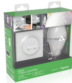
Aroma kit Enchanting scents