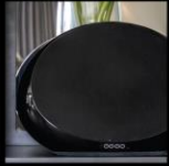
HIGH-FIDELITY AUDIO STREAMING