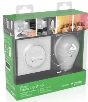
Color kit Inspiring sparkles