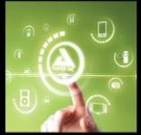
SMART HOME TECHNOLOGIES