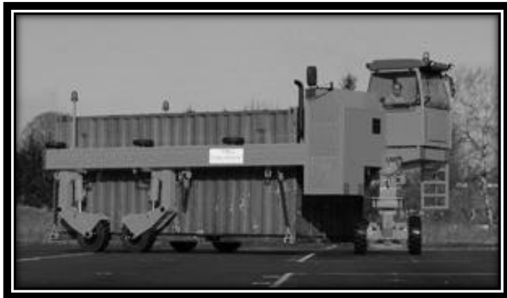
Première version de l'Automoteur en U en 1999.

Depuis 1999, l'ACM a connu de nombreuses évolutions techniques sur l'aspect mécanique et hydraulique.