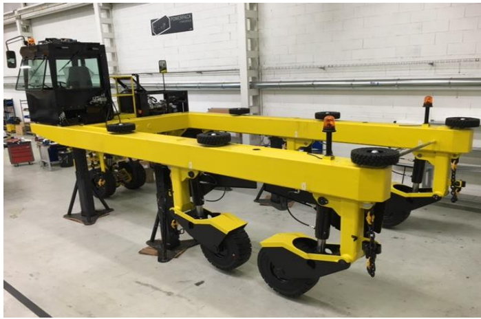
Véhicule en cours d'assemblage à Héricourt