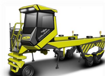
ACM avec pilote