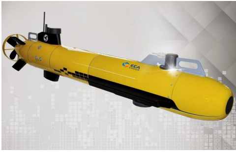
Systèmes Intelligents de Sûreté