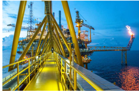
Protection des Installations à Risques