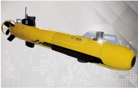
Systèmes Intelligents de Sûreté