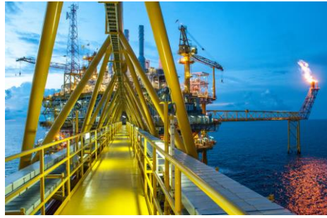
Protection des Installations à Risques