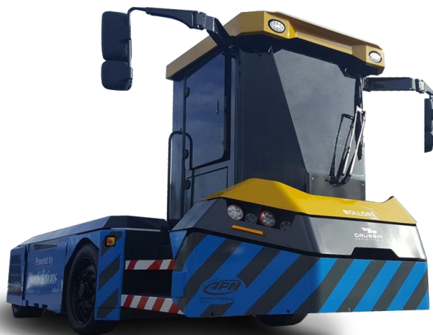
Nouvel APM HE dévoilé au salon SITL 2018

La version existante HE « Hot Environments » 38T, qui sera équipée des batteries LMP® de Blue Solutions sera dévoilé en exclusivité lors du salon. Cette version est principalement destinée aux pays du golfe et à l'Afrique où la volonté de croissance écologique est réelle.