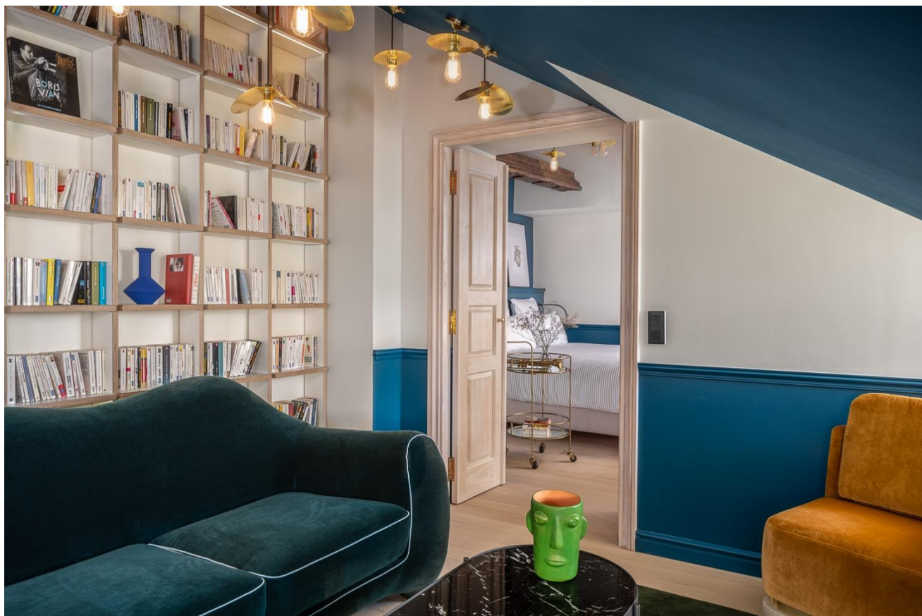
Chouchou, Paris, Hôtel ****