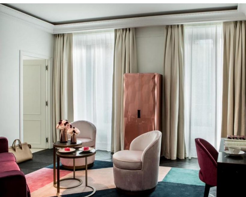
Fauchon L'Hôtel, Paris, Hôtel*****

Capitalisant sur ses récentes réalisations hôtelières, Roche Bobois a engagé une réflexion sur la déclinaison possible de ses valeurs d'audace, de créativité et d'élégance à l'univers hôtelier.