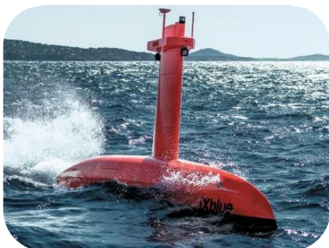
iXblue – Unmanned Surface Vehicle DriX

Enfin, le nouveau groupe aura une plus grande capacité d'investissement pour accélérer ses feuilles de route R&D et renforcer son leadership technologique. Les deux sociétés réunies consolideront ainsi les capacités souveraines françaises et pourront contribuer significativement à l'ambition française du programme Grands Fonds Marins, annoncé par le Président de la République dans le cadre de France 2030 et porté par le Ministère des armées et le Ministère de la mer.