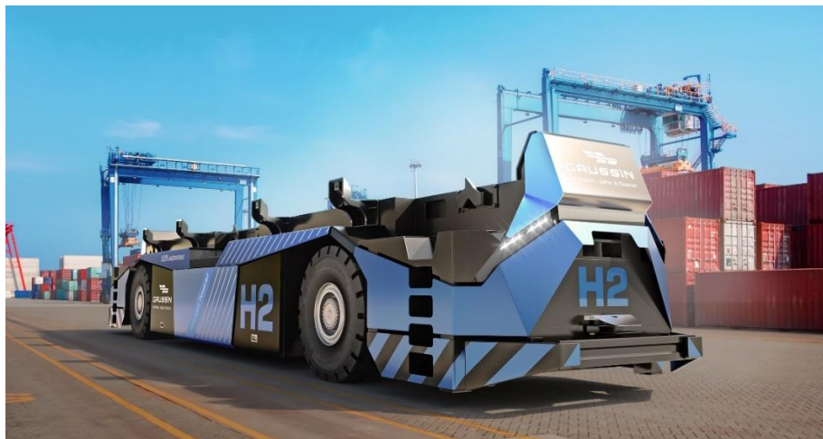
Le nouveau AGV H2 conçu par GAUSSIN

Les ports font traditionnellement appel à des camions et des tracteurs à moteur diesel fonctionnant en grappe pour déplacer les marchandises vers et depuis les navires. Cela contribue de manière significative aux émissions de CO2. De nombreuses études de faisabilité ont montré que les ports sont des sites idéaux pour la circulation de véhicules de transport et les équipements de manutention des conteneurs fonctionnant à l'hydrogène, car ils constituent un lieu naturel pour le transport, le stockage et les sites de ravitaillement en hydrogène pour diverses applications. Les coûts de production de l'hydrogène ayant chuté de plus de 50 % depuis 2015, les véhicules à pile à combustible alimentés à l'hydrogène constituent désormais une solution viable pour les opérateurs portuaires, qui peuvent ainsi atteindre à la fois l'efficacité des opérations et les objectifs écologiques.