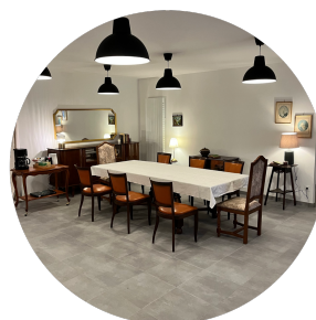
Maison co-living seniors Saint-Saud-Lacoussière (24)

Photos de réalisations disponibles sur simple demande