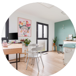
Maison médicale – Toulouse (31)