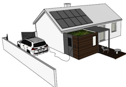
Enerpod Home +

Ces innovations contribuent à l'émergence d'une filière française d'excellence de la rénovation hors-site , alliant performance, sobriété et industrialisation. Synerpod et Airwell ont déjà livré plus de 300 installations sur 2025. Appuyées par un soutien financier de 2,1 M€ , dont 1 M€ d'avances remboursables , l'objectif est de fournir des nouvelles solutions (au propane et totalement connectées) fin 2026.