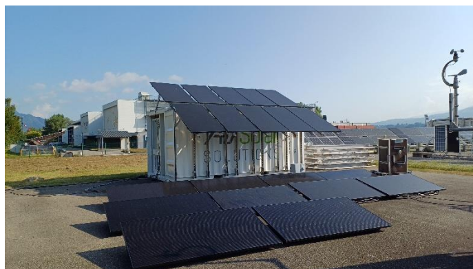
Chambre froide solaire autonome SolarFrost

Finalisée en septembre 2025, la solution a déjà été déployée en Irak et dans les Antilles, confirmant l'intérêt international pour ce dispositif. Le projet, soutenu par 500 000 € de subventions FASEP , témoigne de la capacité d'Airwell à conjuguer innovation, impact social et développement export.