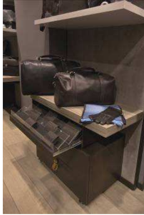
Nouveau concept LE TANNEUR