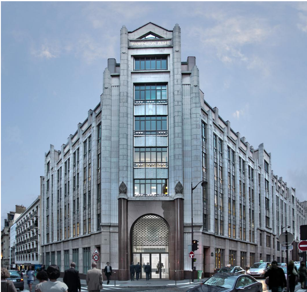
Le nouveau Washington Plaza