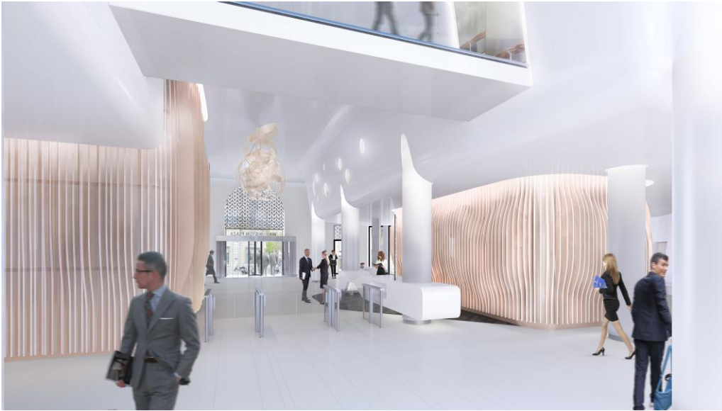
Le projet de lobby sur l'angle Friedland