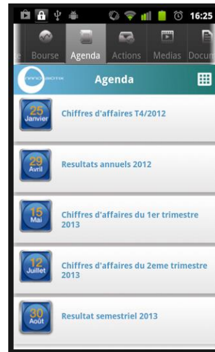
Les dates des prochains communiqués financiers et les rendez-vous à ne pas manquer !