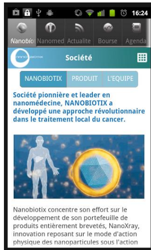
Retrouvez les informations sur Nanobiotix et l'actualité de la nanomédecine