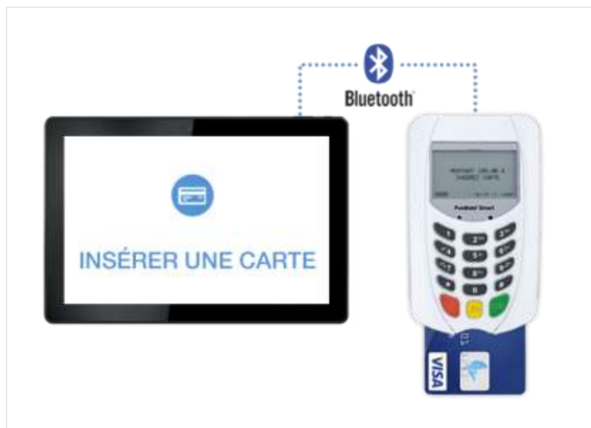
Le MPOS Be2bill