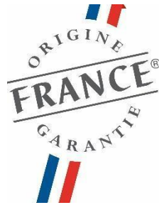
Labélisé service France garanti