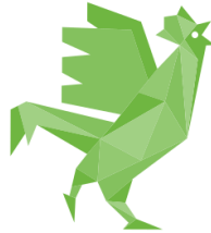
Membre de la communauté du Coq Vert