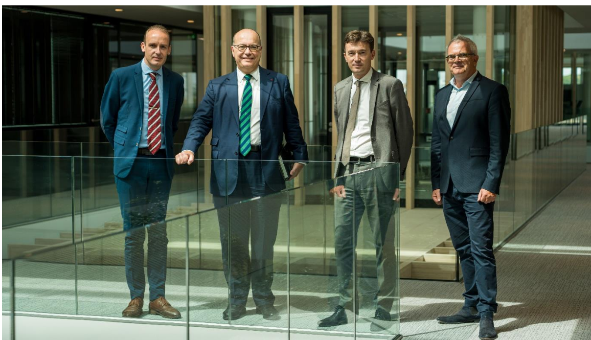
Les équipes de management de Hoffmann Green et Les Maçons Parisiens

Dès 2022 et pour les trois prochaines années, Hoffmann Green livrera aux Maçons Parisiens ses ciments 0% clinker H-IONA et H-UKR en vue de la construction de bâtiments collectifs au sein de la région Île-de-France. L'utilisation des ciments Hoffmann Green par Les Maçons Parisiens permettra ainsi de réduire drastiquement l'empreinte carbone des futurs bâtiments tels que des logements, immeubles de bureaux, équipements publics, hôpitaux, cliniques, maisons d'accueil pour personnes âgées, résidences sociales, foyers, etc.