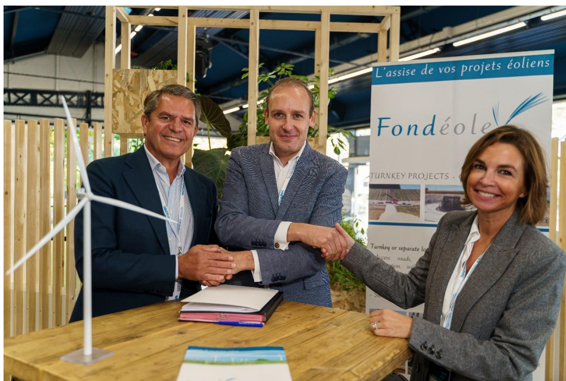
Les équipes de management de Hoffmann Green et du Groupe Fondéole

Acteur historique de l'éolien et constructeur de plus de 800 éoliennes au sein de 140 parcs depuis 2006, le Groupe Fondéole s'engage sur le terrain à utiliser et à promouvoir les ciments Hoffmann auprès de l'ensemble des acteurs français du secteur. Hoffmann Green et le Groupe Fondéole ont pour ambition de construire 50% des fondations d'éoliennes onshore et offshore en ciments Hoffmann à horizon 2028, ce qui représente environ 50 000 tonnes de ciments.