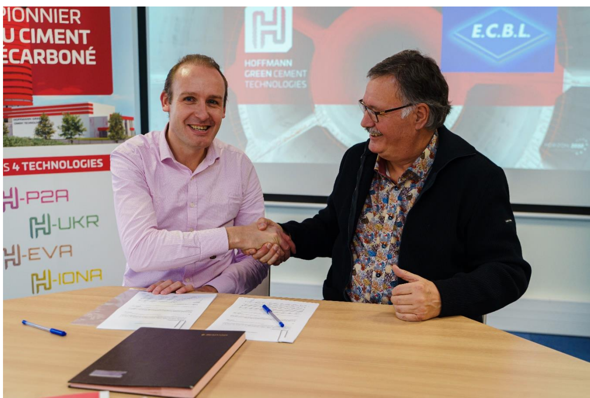
Les équipes de management de Hoffmann Green et d'E.C.B.L.

Hoffmann Green fournira à E.C.B.L., pour les trois prochaines années, son ciment décarboné sans clinker en vue de la réalisation de travaux de gros œuvre tels que la construction de logements collectifs, de bâtiments industriels, publics, privés, tertiaires et de bureaux ; ainsi que des réhabilitations conséquentes afin de restaurer le patrimoine. Il s'agit du premier contrat avec engagement de volumes signé par Hoffmann Green avec une entreprise générale du bâtiment dont le siège est implanté à proximité de la Société vendéenne. Ce partenariat illustre le dynamisme et l'innovation présents localement en faveur de la décarbonation du secteur du bâtiment.