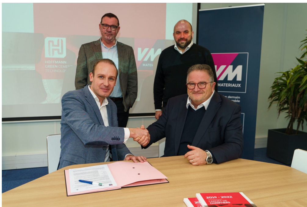
Les équipes de management de VM Matériaux et d'Hoffmann Green

Signé lundi 30 janvier, l'accord prévoit une mise en place du partenariat courant février.