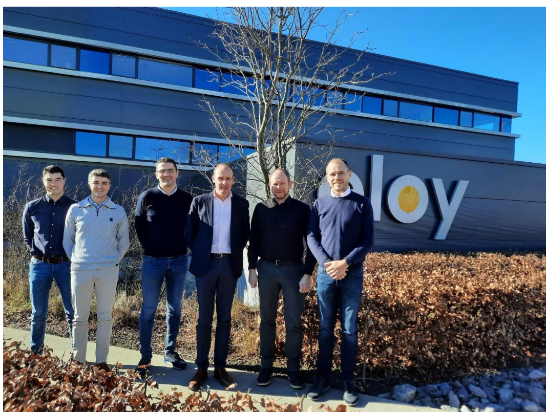
Les équipes de management d'Eloy et d'Hoffmann Green

Dans le prolongement de cette démarche, Eloy a signé un partenariat avec Hoffmann Green Cement afin que les deux acteurs procèdent à des essais techniques spécifiques et élaborent ensemble des formulations de béton fondées sur les technologies 0% clinker d'Hoffmann Green Cement.