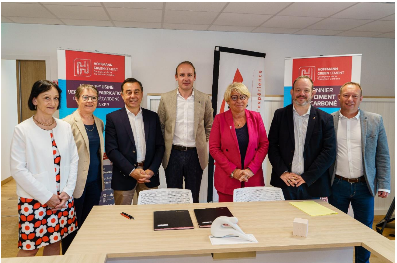
Les équipes de management de Vendée Habitat et d'Hoffmann Green

Comme annoncé par Hoffmann Green au début du mois de juin, cette collaboration permettra de construire des logements neufs qui répondront à la stratégie bas carbone, aux exigences des futures réglementations thermiques et qui viseront l'atteinte des objectifs de neutralité carbone d'ici 2050 du département. Ce partenariat durable et engagé dans une démarche ambitieuse et respectueuse de l'environnement est conclu sans durée dans le temps.