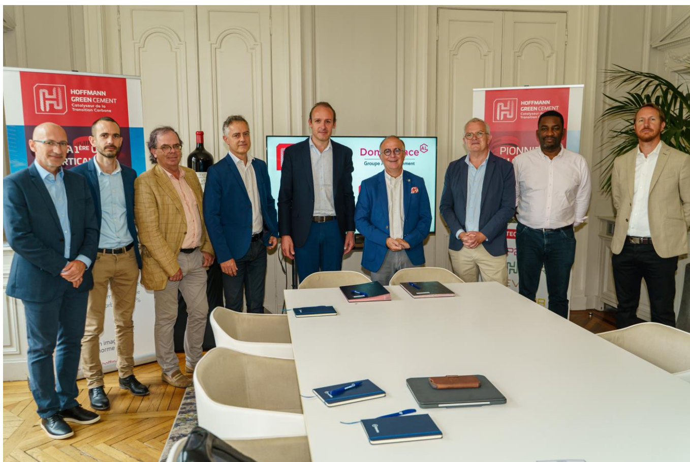
Les équipes de management de Domofrance et d'Hoffmann Green

Distingué pour ses engagements en matière de Responsabilité Sociétale des Entreprises avec l'obtention en 2021 du label B Corp, une première pour un bailleur social. Domofrance poursuit cette dynamique en s'engageant à prescrire les bétons à base de ciments Hoffmann 0% clinker.