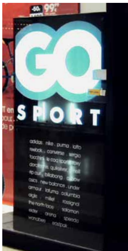
GO SPORT, Italie II, Paris, France