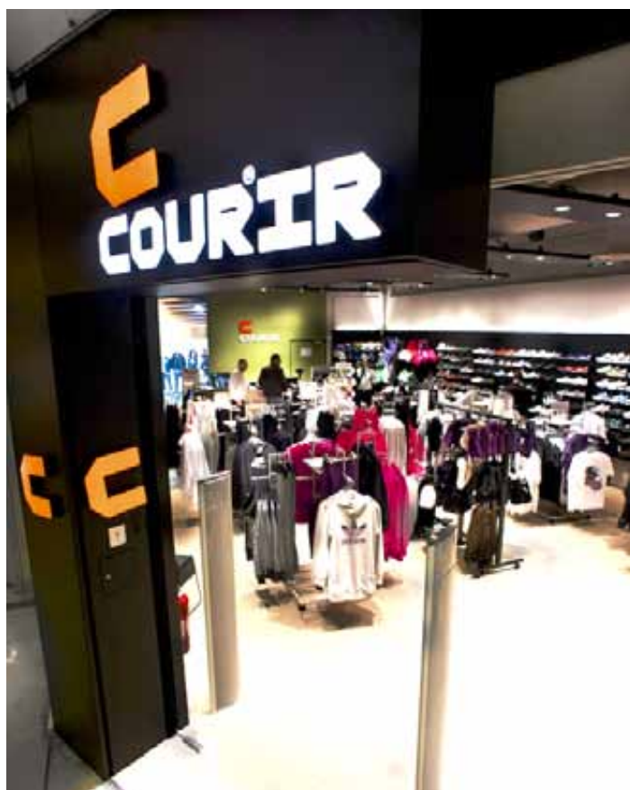
COURIR, Parinor, France