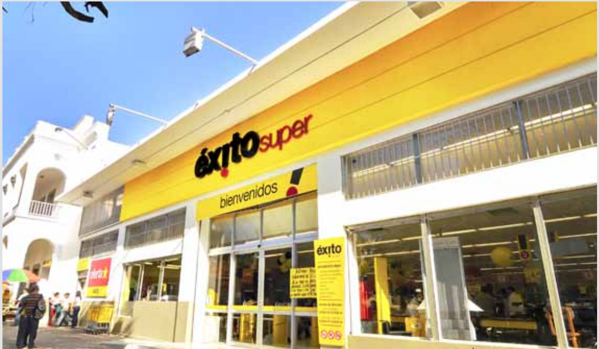
ÉXITO, Sincelejo, Colombie