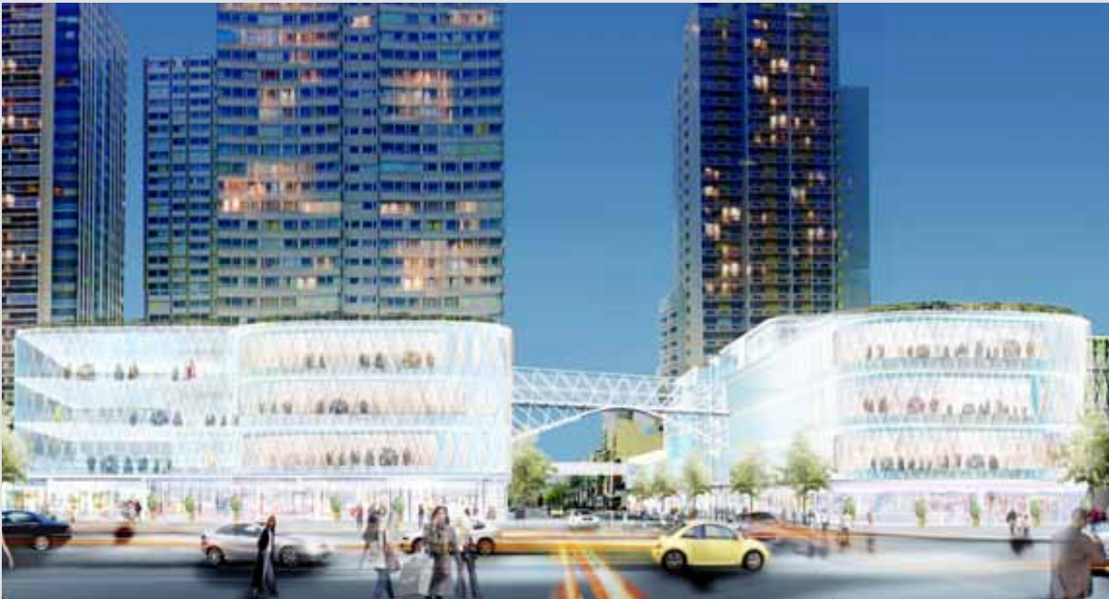
BEAUGRENELLE, Paris XV, France