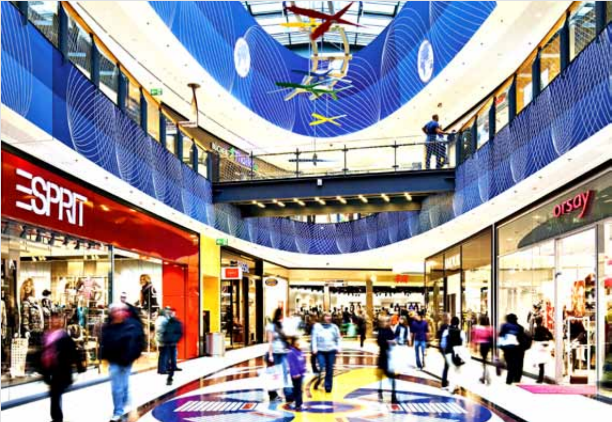
LOOP 5, Weiterstadt, Allemagne