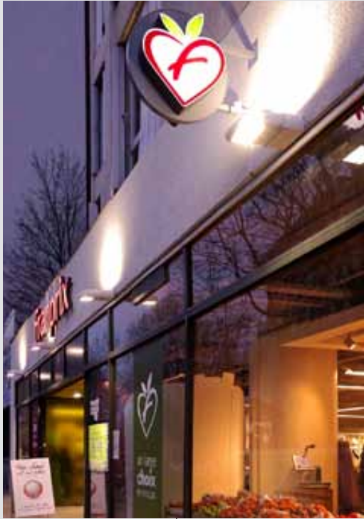
FRANPRIX, Paris XI e , France