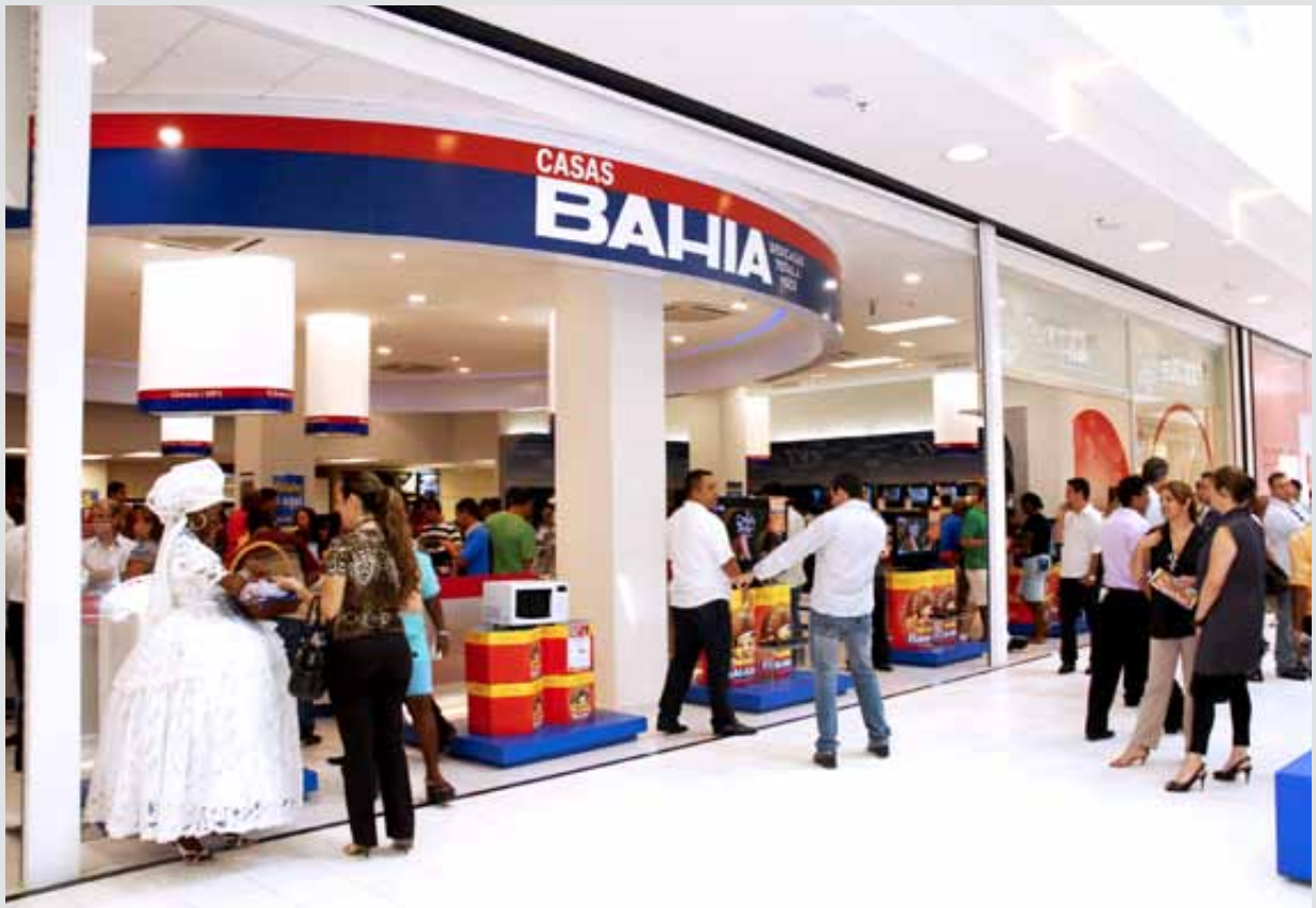
CASAS BAHIA, São Paulo, Brésil