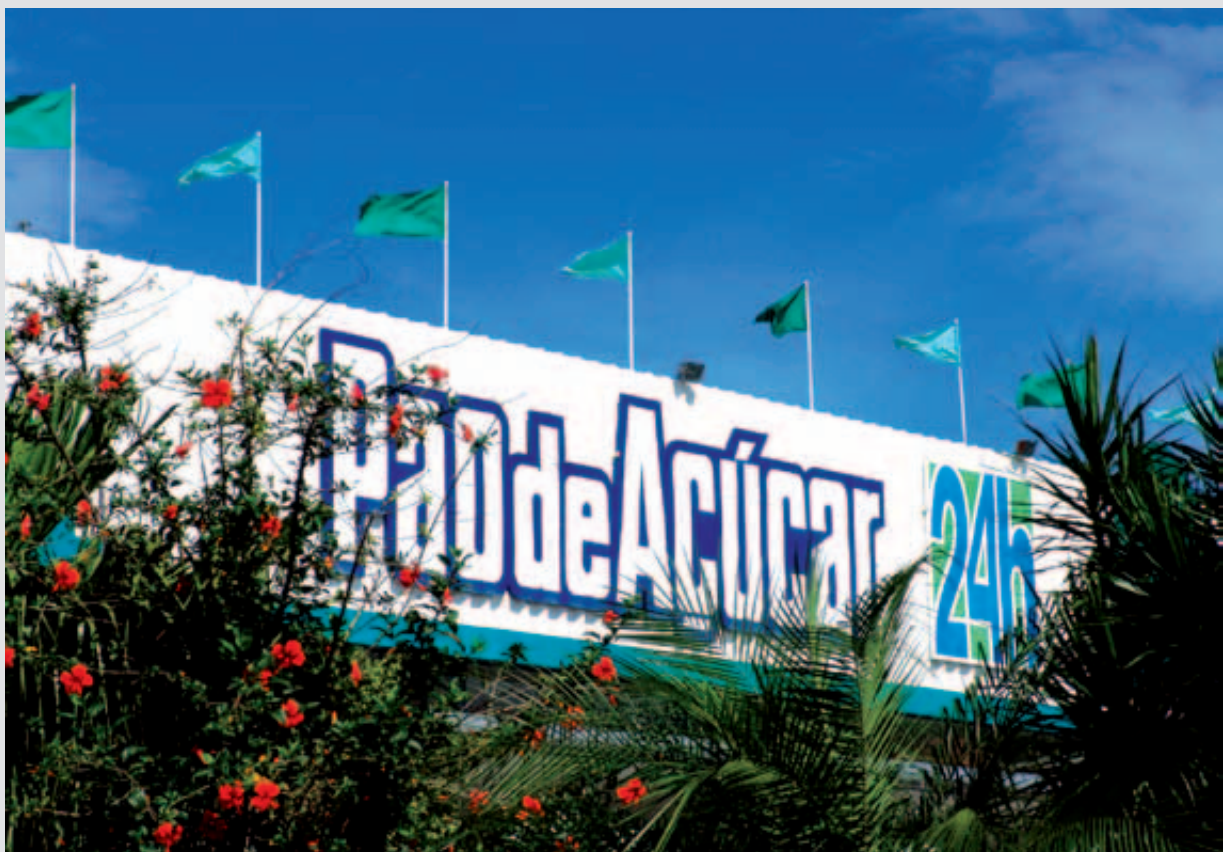
PÃO DE AÇÚCAR, São Paulo, Brasil