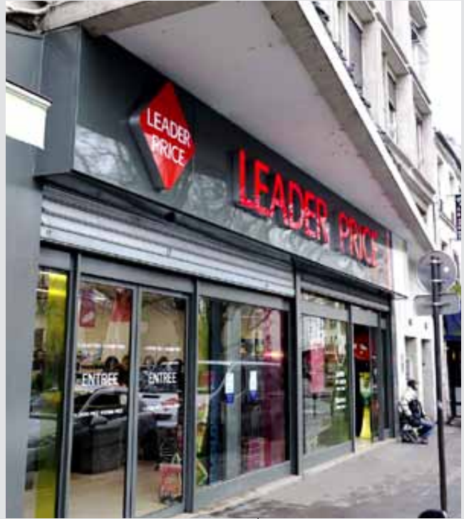
LEADER PRICE, Paris XI e , France