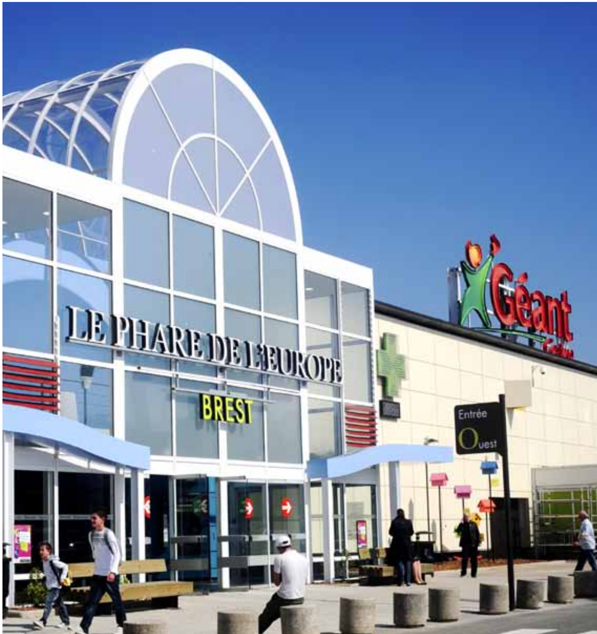
GÉANT CASINO, Brest, France

Les dettes financières, nettes des disponibilités et valeurs mobilières de placement, s'élèvent à 115,9 M€ au 31 décembre 2010.