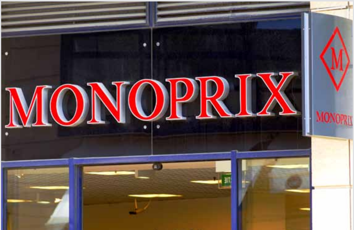
MONOPRIX, Aix-en-Provence, France