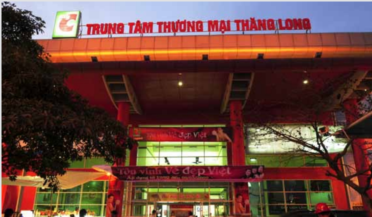
BIG C, Thang Long-Hanoi, Việt Nam