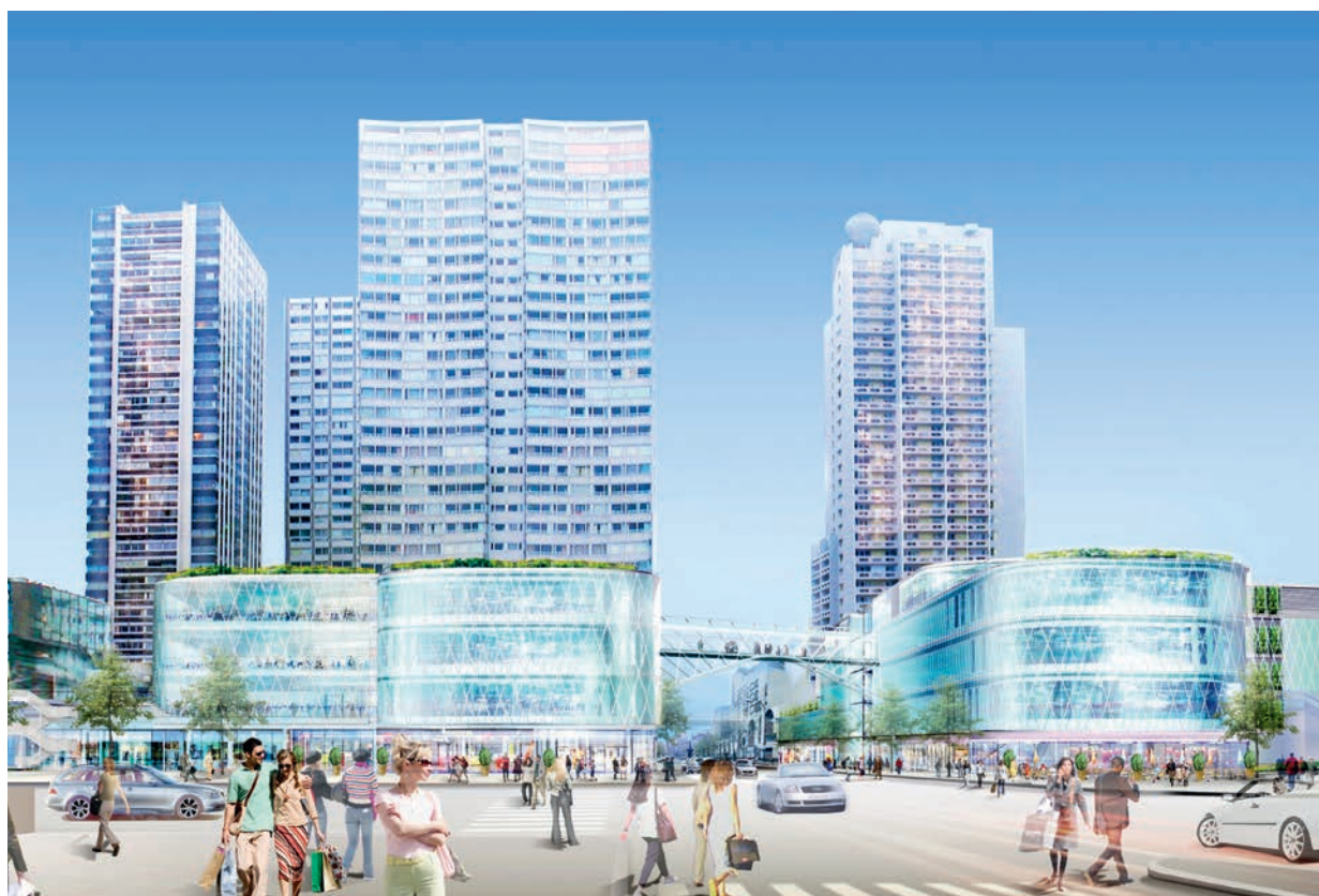
BEAUGRENELLE, Paris, France

Principal actif de Rallye, dont il représente 98% du chiffre d'affaires consolidé, Casino est un acteur majeur de la distribution à dominante