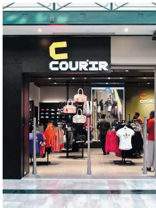
| COURIR, Val d'Europe, France

En Amérique latine, les ventes progressent de 8,8% en organique, portées par une croissance à deux chiffres à magasins comparables. Le résultat opérationnel courant de l'Amérique latine s'est élevé à 1 060 M€ en 2012, en hausse de 87,7%. Au Brésil, la marge du cash & carry (vente en gros) continue sa progression et la réalisation des synergies entre Casas Bahia et Ponto Frio se poursuit. En Colombie, la performance est très satisfaisante sur tous les formats et les coûts d'expansion sont bien maîtrisés.