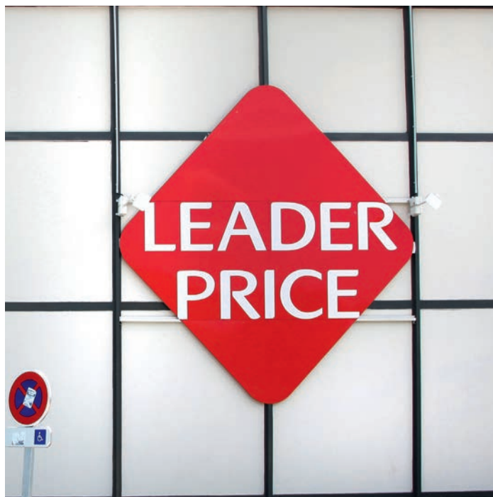
| LEADER PRICE, Saint-Étienne, France