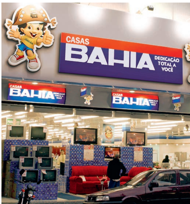
| CASAS BAHIA, São Paulo, Brésil