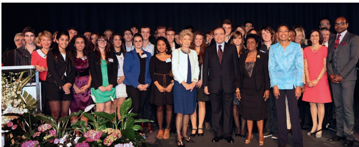
CÉRÉMONIE EN L'HONNEUR DES BOURSIERS DE LA FONDATION EURIS, Pavillon Gabriel, le 24 octobre 2012

Placée sous l'égide de la Fondation de France, la Fondation Euris attribue, depuis sa création en juin 2000, chaque année 40 bourses d'études supérieures à des lycéennes et lycéens titulaires d'une men-