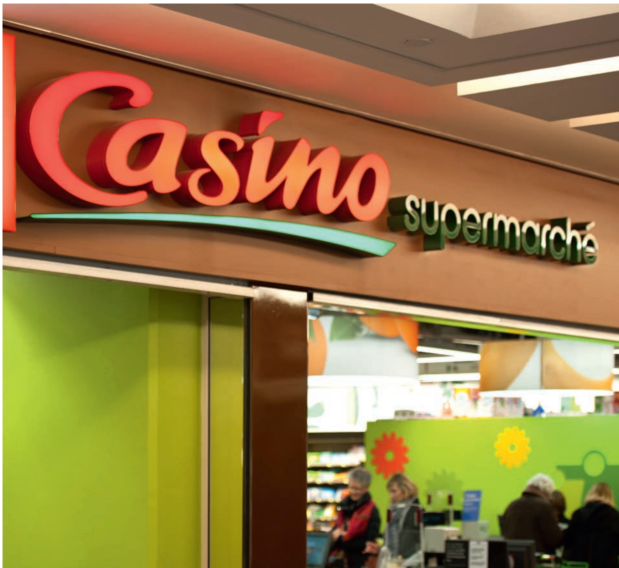
| CASINO SUPERMARCHÉ, Paris, France

Les dettes financières, nettes des disponibilités et valeurs mobilières de placement, s'élevaient à 110,6 M€ au 31 décembre 2012.