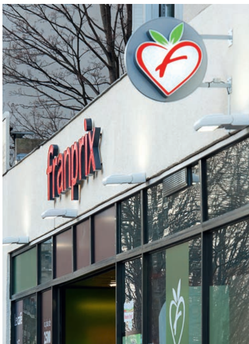
| FRANPRIX, Paris, France

L'International a contribué à hauteur de 56% au chiffre d'affaires du Groupe et à hauteur de 66% au résultat opérationnel courant (contre une contribution de 45% au chiffre d'affaires et 52% au résultat opérationnel courant en 2011).