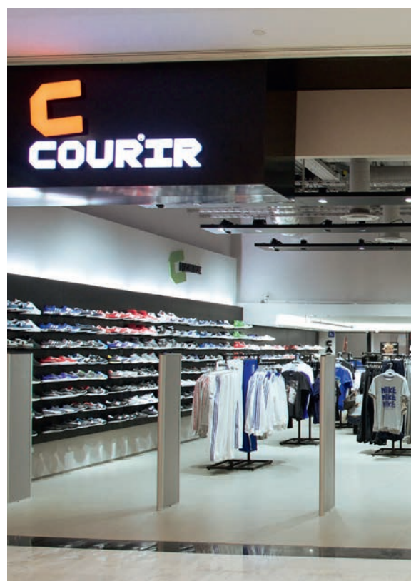
| COURIR, Parly 2, France