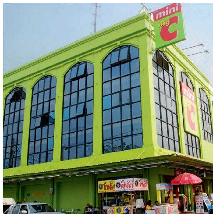
| MINI BIG C, Bangkok, Thaïlande