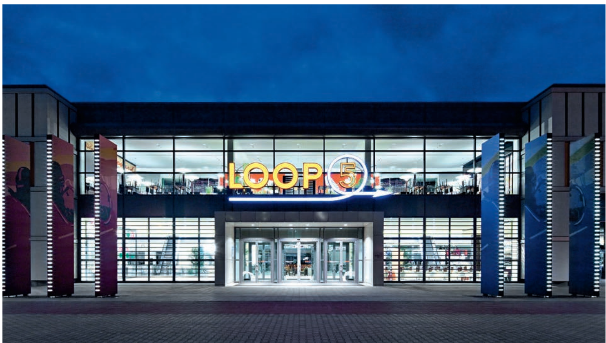
| LOOP 5, Weiterstadt, Allemagne