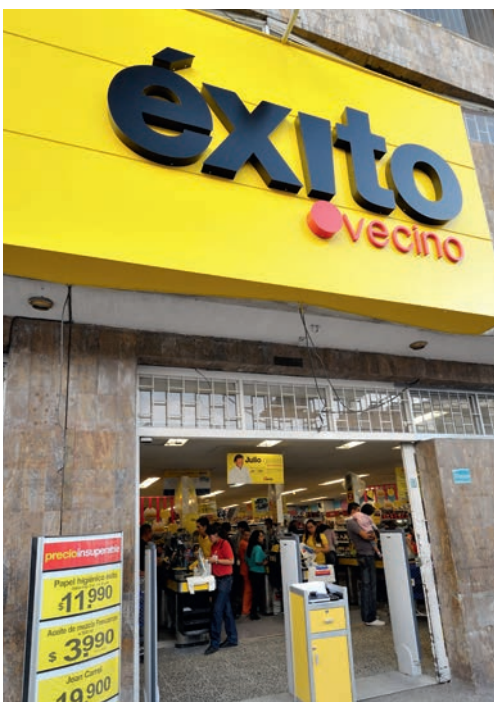
| EXITO VECINO, Bogotá, Colombie