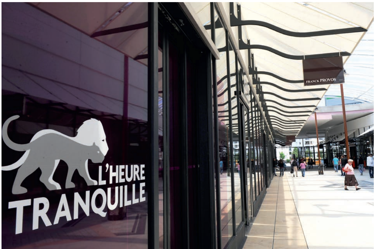
| L'HEURE TRANQUILLE, Tours, France