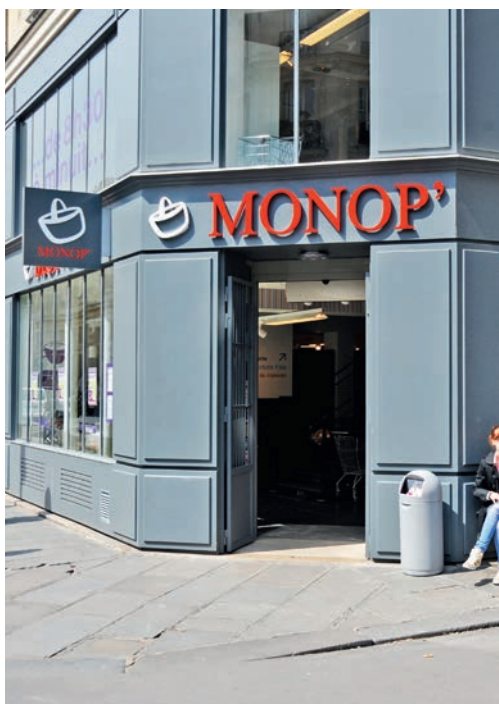
| MONOPRIX, Paris, France

L'International a contribué à hauteur de 56% au chiffre d'affaires du Groupe et à hauteur de 66% au résultat opérationnel courant (contre une contribution de 45% au chiffre d'affaires et 52% au résultat opérationnel courant en 2011).