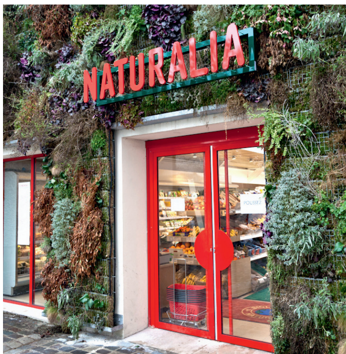
| NATURALIA, Fontainebleau, France