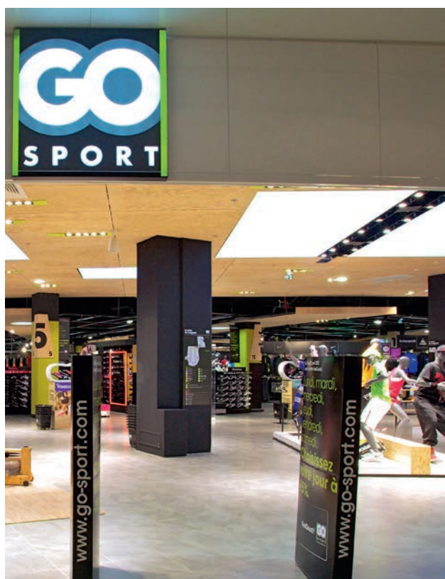
| GO SPORT, La Défense, France

Le chiffre d'affaires est en hausse de 22,1% pour s'élever à 41 971 M€. En organique (à périmètre comparable, taux de change constants et hors impact des cessions immobilières), la hausse est de 3,5%. Le résultat opérationnel courant a fortement progressé de 29,3% à 2 002 M€ (3% en organique). Cette croissance élevée a été tirée par les filiales à l'étranger et provient notamment de l'effet de l'intégration globale de GPA à compter du deuxième semestre. Le résultat net part du Groupe progresse de 87,1% à 1 062 M€. Le résultat net normalisé part du Groupe, qui permet de mesurer l'évolution du résultat récurrent des activités, reste stable par rapport à l'an dernier à 564 M€.