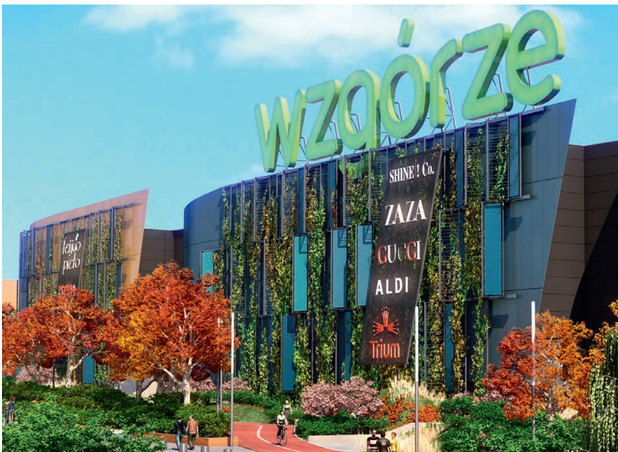
| WZGORZE, Gdynia, Pologne