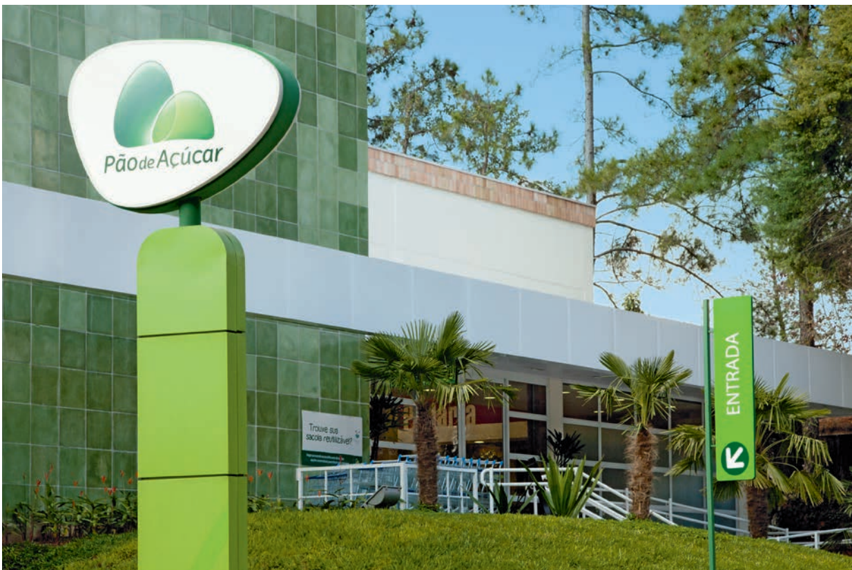
| PÃO DE AÇÚCAR, São Paulo, Brésil