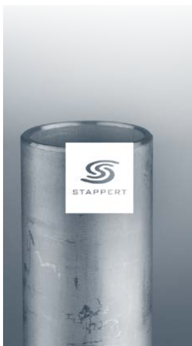
Produits longs inox