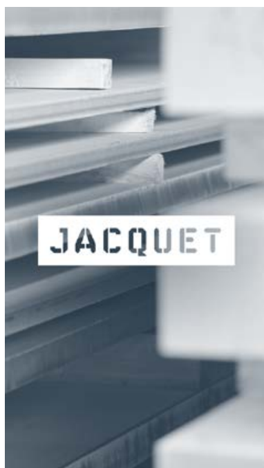
Tôles quarto inox