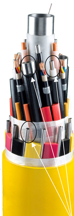
Coupe d'un ombilical