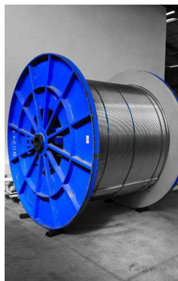
Tubes Vallourec sur bobine