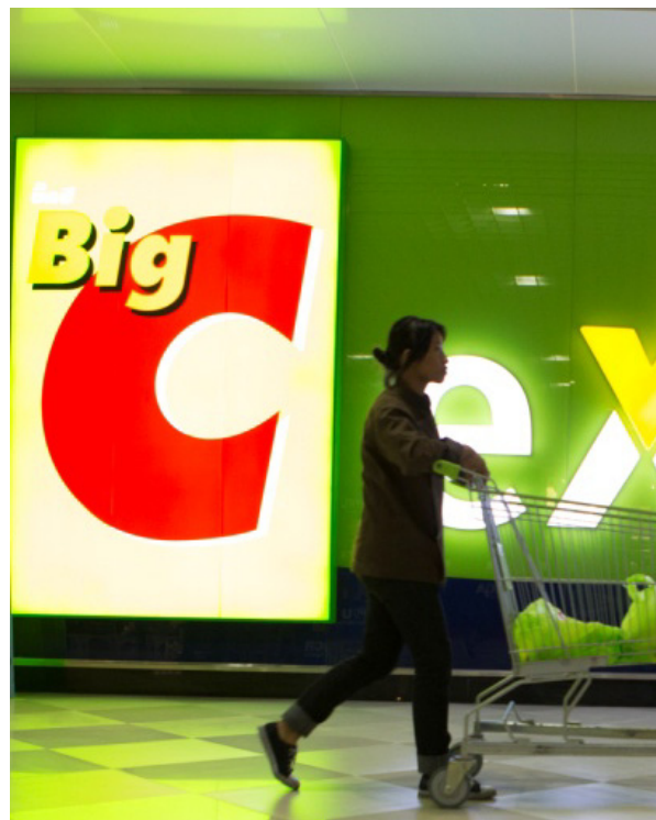
BIG C EXTRA, Bangkok, Thaïlande