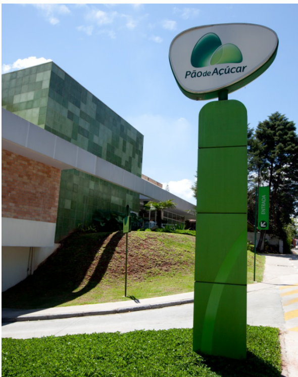
PÃO DE AÇÚCAR, São Paulo, Brésil

Les ventes de l'International sont en hausse de 23,9% à 29 153 M€, bénéficiant de la consolidation par intégration globale de GPA en année pleine sur 2013. En organique, les ventes de l'International progressent de 11,2%. Le résultat opérationnel courant de l'International s'est établi à 1 745 M€, en hausse de 32,6% (+22,7% en organique).