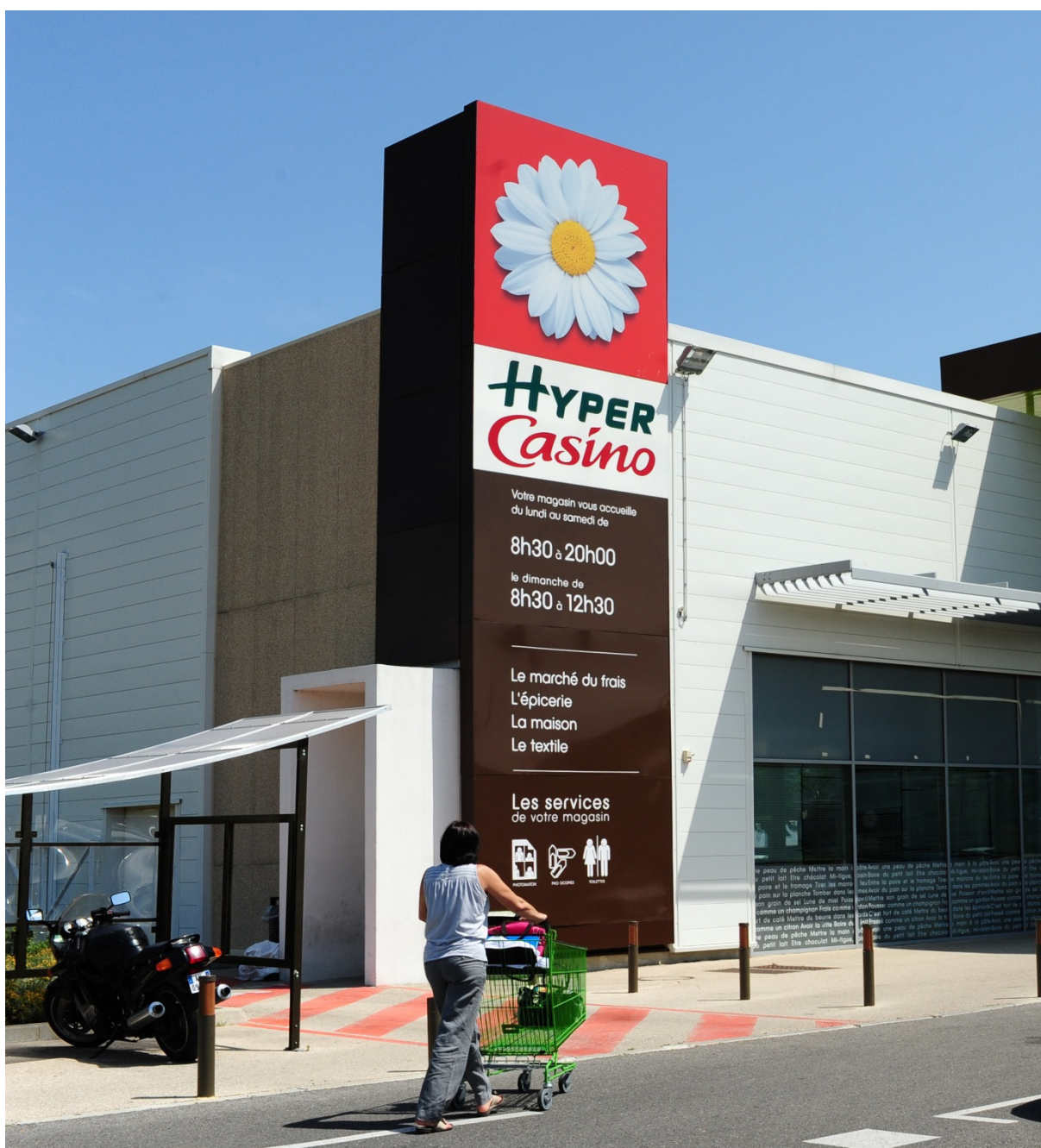
HYPER CASINO, Saint-Laurent des Arbres, France

Les dettes financières, nettes des disponibilités et valeurs mobilières de placement, s'élèvent à 107,5 M€ au 31 décembre 2013.