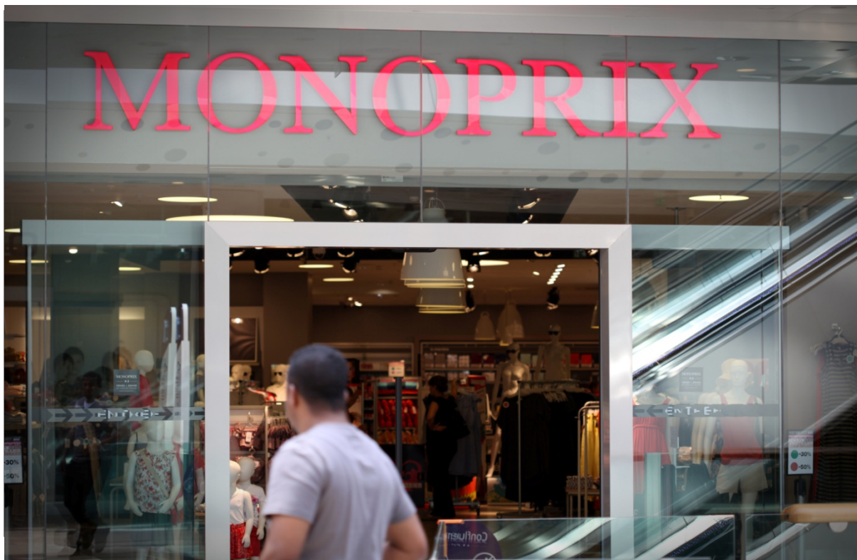
MONOPRIX, Lyon, France

Le chiffre d'affaires du Groupe est en hausse de 15,9% pour s'élever à 48 645 M€. En organique (à périmètre comparable, taux de change constants et hors impact des cessions immobilières), la hausse est de 4,5%. Le résultat opérationnel courant a fortement progressé de 18,1% à 2 363 M€. Cette croissance élevée a été tirée par les filiales à l'étranger et provient notamment de l'effet de l'intégration globale de GPA en année pleine sur 2013. Le résultat net part du Groupe publié s'établit à 851 M€ contre 1062 M€ en 2012, sous l'effet de la diminution des produits non récurrents. Le résultat net normalisé, qui permet de mesurer la profitabilité récurrente, progresse de 9,7% à 618 M€.