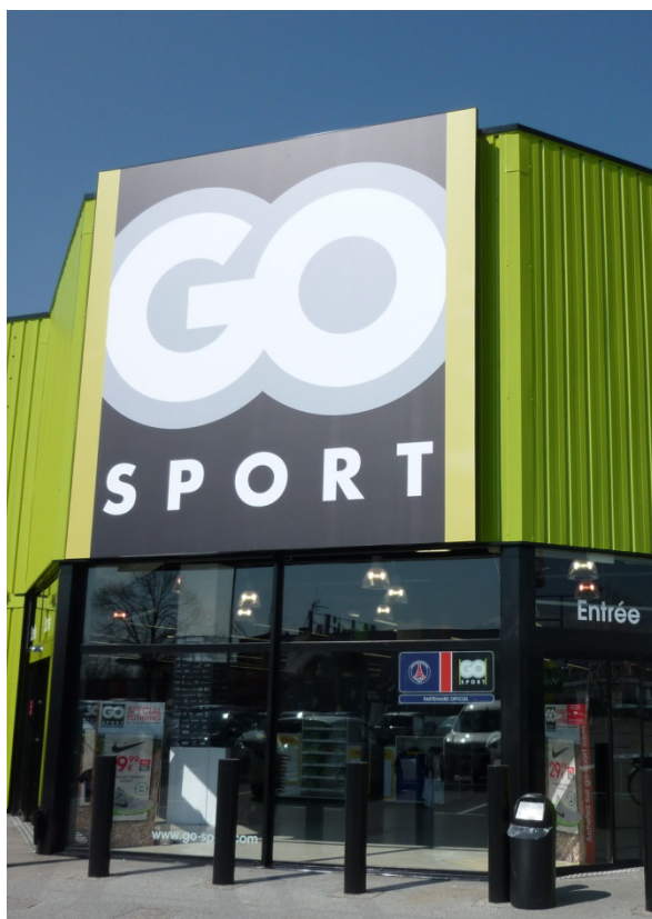
GO Sport, Comboire, France