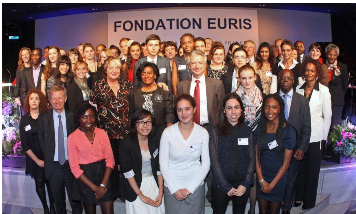
| CÉRÉMONIE EN L'HONNEUR DES BOURSIERS DE LA FONDATION EURIS, Pavillon Gabriel, le 16 octobre 2013

Au titre de l'année universitaire 2013-2014, la Fondation Euris a examiné 274 dossiers. Ces dossiers proviennent de 22 des 30 académies de France métropolitaine et d'outre-mer et de 80 lycées.