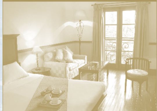
VICTORIA CAN THO RESORT