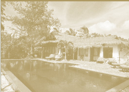
VICTORIA PHAN THIET BEACH RESORT