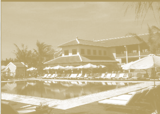
VICTORIA HOI AN BEACH