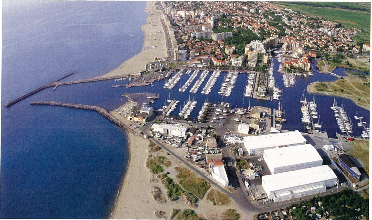
USINE DE CANET EN ROUSSILLON (PYRENEES ORIENTALES)