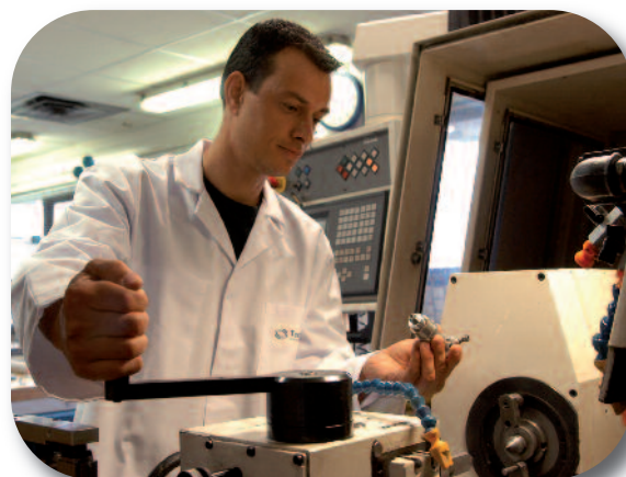
Département des rotors

Aucune prise de participation n'est intervenue en 2008.