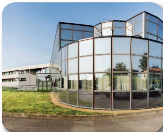
Technofan : siège social à Blagnac (31)

De même, le chiffre d'affaires après-vente est en baisse de 10% entre 2007 et 2008, résultant à la fois de l'évolution défavorable du taux de change euro/dollar et du recul des ventes d'équipements complets de rechange aux compagnies aériennes. On note néanmoins, malgré ce contexte, une stabilité des chiffres d'affaires de réparation et de vente de pièces détachées.