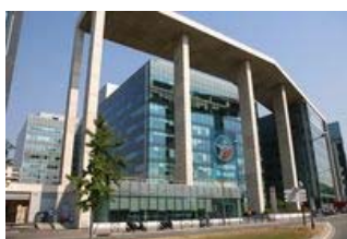
Arcs de Seine