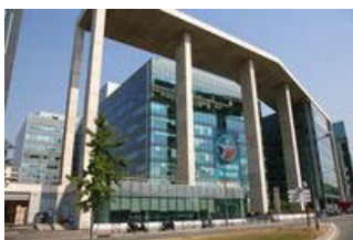
Arcs de Seine