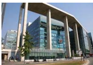
Arcs de Seine