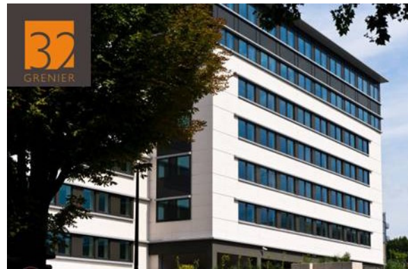
32 Grenier – Boulogne Billancourt