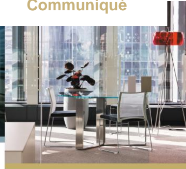
CB 21 – LA DÉFENSE