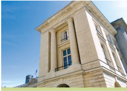
FRANCE TÉLÉCOM – REIMS