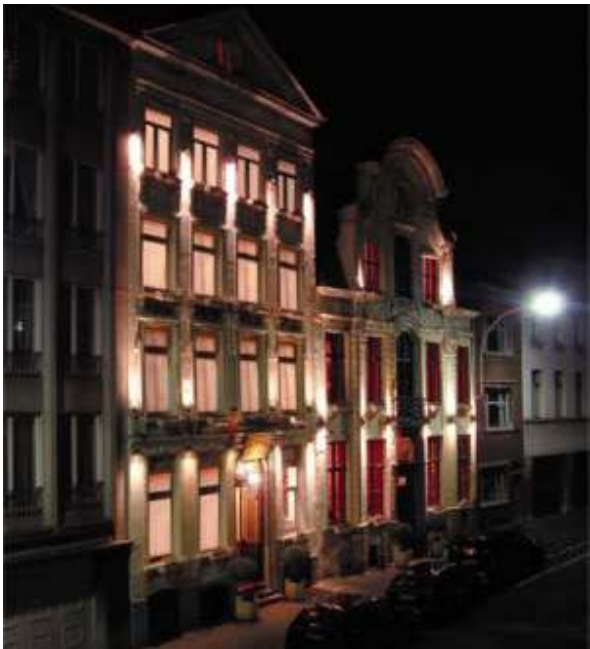
© Hôtel de Bourgtheroulde - Rouen