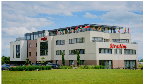
Siège social à Entzheim (67)

Retrouvez nos publications sur notre site www.stradim.fr rubrique Stradim en Bourse