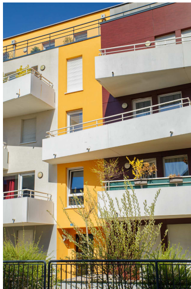
Programme rue du Maquis à Strasbourg

Cette année, nous avons livré physiquement 649 appartements très majoritairement certifiés par l'organisme Cerqual.