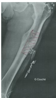
La zone hachurée correspond à l'os pathologique que le Pr Gayet souhaitait remplacer

L'implant d'I.CERAM a permis d'éradiquer l'infection en remplaçant la partie du fémur infectée qui s'étendait sur 5 cm, de remettre sur pied le patient et de sécuriser l'opération ainsi que l'implant de toute nouvelle bactérie grâce à la diffusion de la gentamicine contenue dans la pièce CERAMIL®.