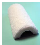
Tuile réalisée par I.CERAM chargée en gentamicine 3 cm de diamètre x 5 cm de long