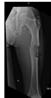
Radiographie post-opératoire à 1 mois