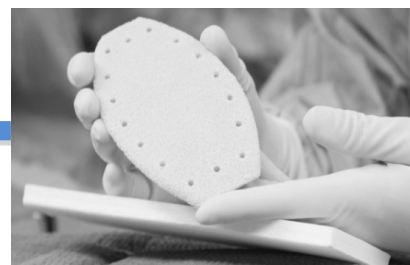
Implantation du sternum Céramil®

L'implantation de ce sternum en céramique a permis de reconstruire une cage thoracique plus fonctionnelle et de corriger l'aspect visuel du thorax de la jeune fille. L'opération s'est bien déroulée et la patiente pourra retourner chez elle d'ici les prochains jours.