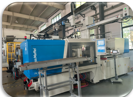
Technologie Roctool installée dans les locaux de ENRX Shanghai en Chine

Comme prévu dans leur accord stratégique, Roctool et ENRX ont terminé l'installation du nouveau centre de démonstration en Chine, avec pour objectif de promouvoir la technologie directement au sein de l'usine de ENRX à Shanghai. Le centre de démonstration aux Etats-Unis, dans l'usine ENRX à Detroit est en phase d'installation et sera également opérationnel dans les prochaines semaines. Ces deux centres pourront participer à accélérer le nombre de projets au cours du deuxième semestre 2024.