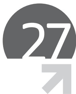
Table de réconciliation (vers les rapports financier et de gestion)

Afin de faciliter la lecture du rapport financier annuel (Article L. 451-1-2 du Code monétaire et financier et article 222-3 du Règlement Général de l'Autorité des Marchés Financiers) et du rapport de gestion social et consolidé de Rhodia (Article L. 225-100 et suivants du Code de commerce) intégrés dans le présent document de référence, la table de réconciliation suivante permet d'identifier les chapitres les constituant.